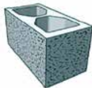
ABOUT / ANGLE 19x19x39