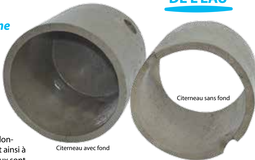
Citerneau avec fond

Cet élément est utilisé dans plusieurs types d'activités (TP, traitement de l'eau, agriculture, environnement) il permet de loger à l'intérieur une vanne, une pompe, un branchement (un T, un Y, ou une croix de branchement). Les différents citerneaux sont tous équipés de rehausses permettant de rallonger la hauteur de plus de 4 mètres s'adaptant ainsi à tous les terrains naturels. De plus les citerneaux sont équipés à la demande de tampon en fonte, d'échelons et crosse, de grille galvanisée... Réserve de tous diamètres possibles.