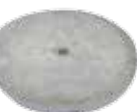
Trappe de Couvercle