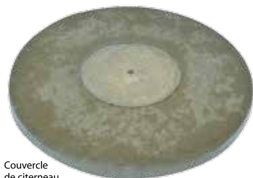
Couvercle de citerneau