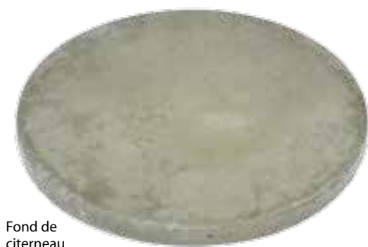
Fond de citerneau