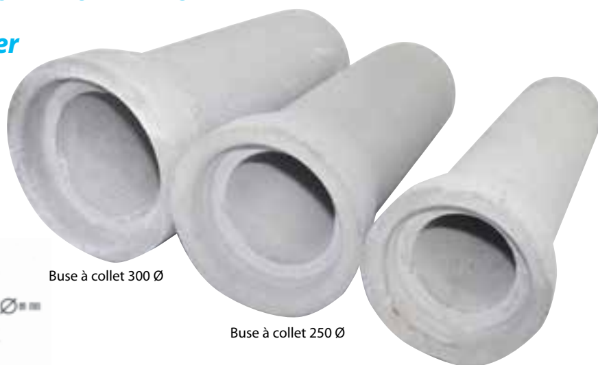
Buse à collet 300 Ø

D'une longueur standard de 1000 mm, disponible en plusieurs diamètres, elle est conçue pour répondre à toutes les situations. Elle sert principalement à buser les talus ou les accès.