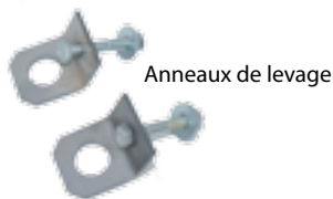
Anneaux de levage