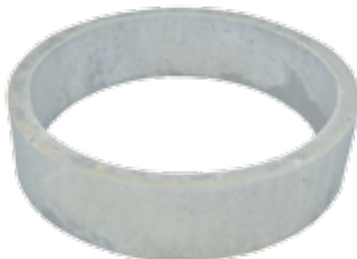
Rehausse de bac 200