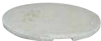
Couvercle de bac