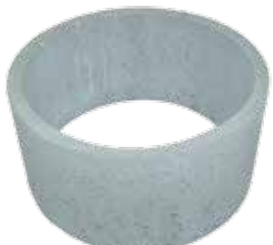
Rehausse de bac 400