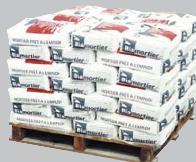
Palette de sacs