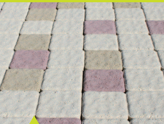
Pavette Chambord Mixés