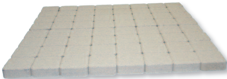
Pavette Chambord Charente

Nous vous conseillons de les mixer ensemble afin d'obtenir une nuance subtile de couleur qui mettra en contraste vos jardins environnants.